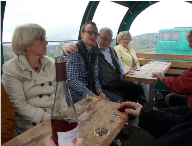
Feine Erdener Weine wurden bei der Fahrt genossen.