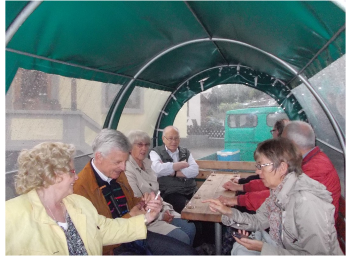
Mit dem Planwagen, ausgestattet mit Erdener Köstlichkeiten, starteten die Fernschachfreunde zu einer gemütlichen Rundfahrt.