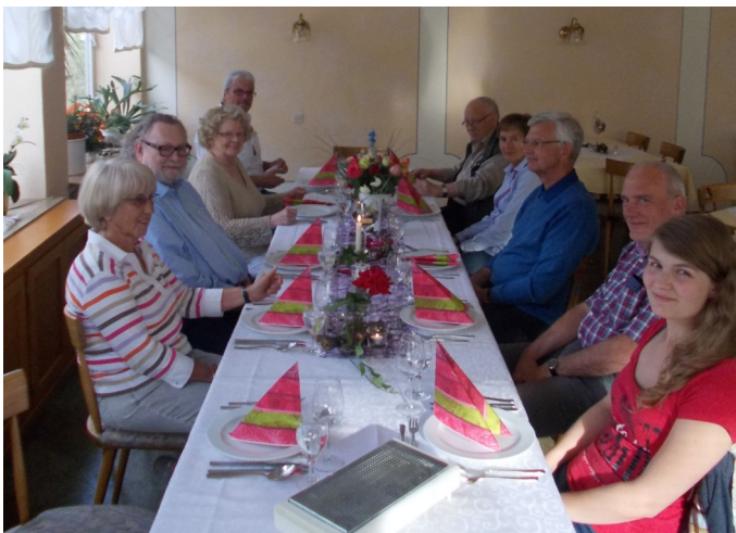
Die Teilnehmer genossen die Ansprache in entspannter Atmosphäre.