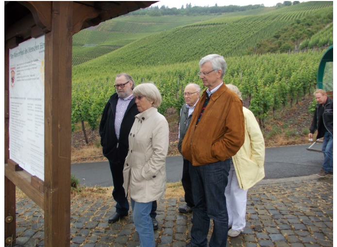
Die Ausflügler erfuhren Interessantes über die Region.