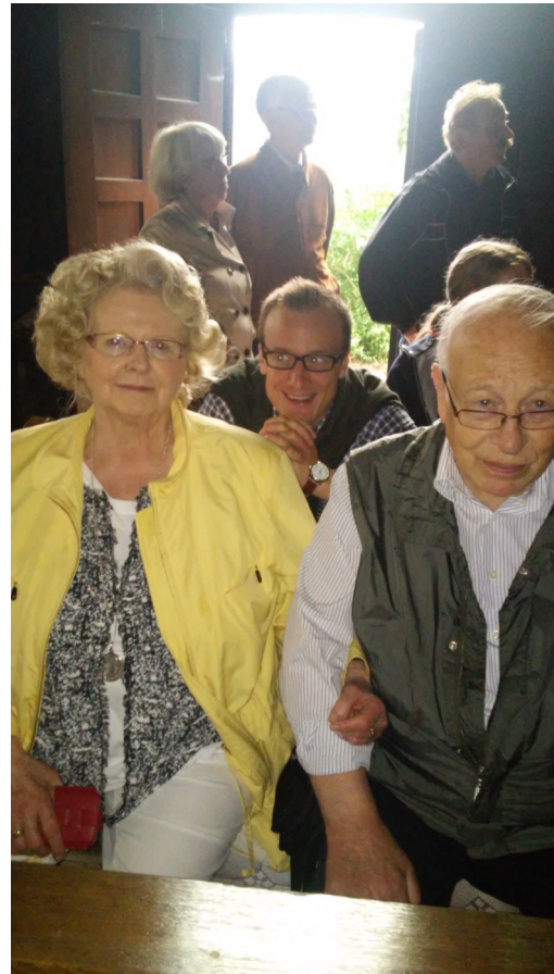
Die „Gemeinde“ lauschte andächtig.