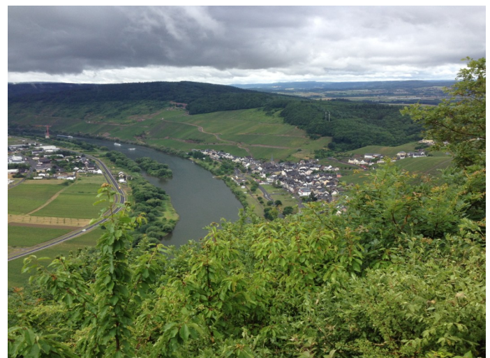
Die Gäste erlebten fantastische Fernblicke.