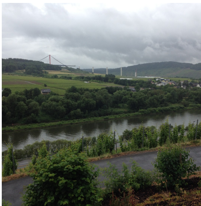
Die neue Moselhochbrücke war ein Thema beim Ausflug.

nik der Moselhochbrücke findet sich zum Beispiel in Wikipedia.) Nach der Rast geht es zügig - und rumpelnd - im Nieselregen zurück, bergab nach Erden zum abschließenden vierten Teil der Reise: Im Weinhaus Schwaab stellt uns Mutter Gabriele gegen