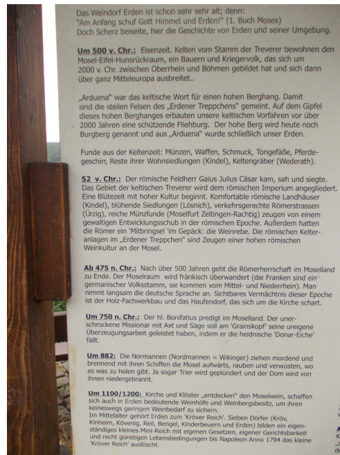
Schon in der Bibel wird es erwähnt: „Am Anfang schuf Gott Himmel und Erden...“ Erden ist mit Recht stolz auf seine lange Tradition im Weinbau.