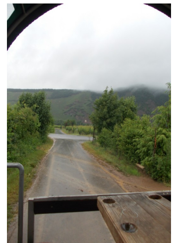
Mit dem Planwagen fahren die Gäste schöne Wege.

Von dort aus haben wir (nicht nur, aber auch) im Sonnenlicht einen direkten Blick auf die Baustellen der hochumstrittenen Hochmoselbrücke zwischen Ürzig und Zeltigen-Rachting, die in einer Länge von gut 1700 Metern und in einer Höhe von bis zu 158 Metern die B 50 über das Moseltal führen soll und ursprünglich, in den