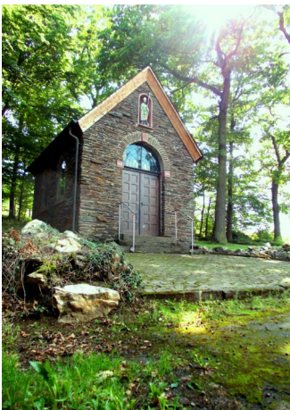
Die erste Station der Planwagenfahrt war die Kapelle am Waldrand oberhalb der Weinberge.

Donnerstag, 18. Juni 2015, gegen 10 Uhr. Das erste gemeinsame Frühstück im Hotel Hanio neigt sich dem Ende zu. Am Moselufer fährt ein Unimog vor, klein, kompakt und leistungsstark, hintendran ein grüner zwölfsitziger Planwagen, am Steuer vorn Uwe Schwaab, Besitzer des gleichnamigen Weinhauses, auf der Ladefläche