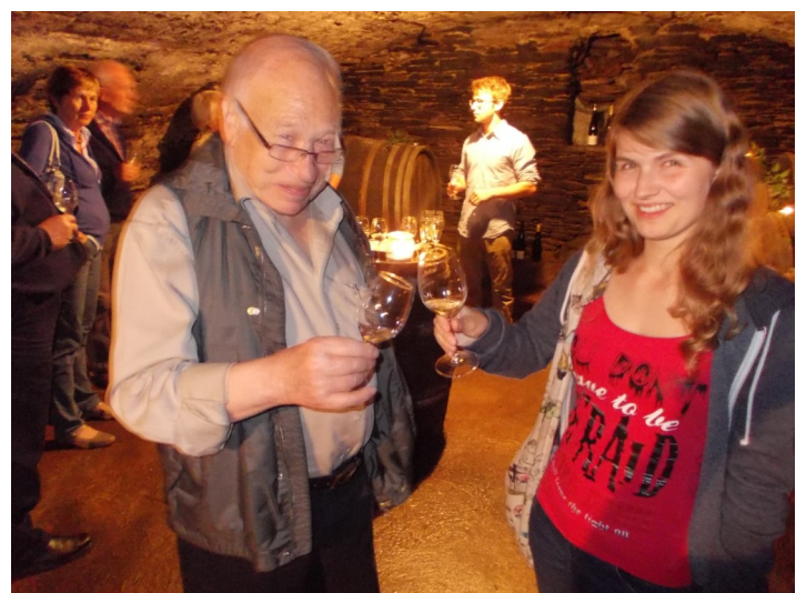
Die Stimmung war prächtig, was nicht zuletzt am guten Tropfen lag.