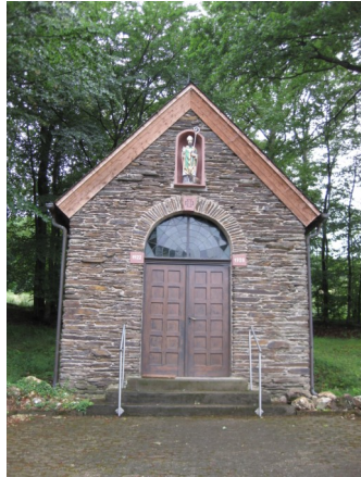
Die Waldkapelle von Erden hat für den RSK Moers eine ganz besondere Bedeutung.