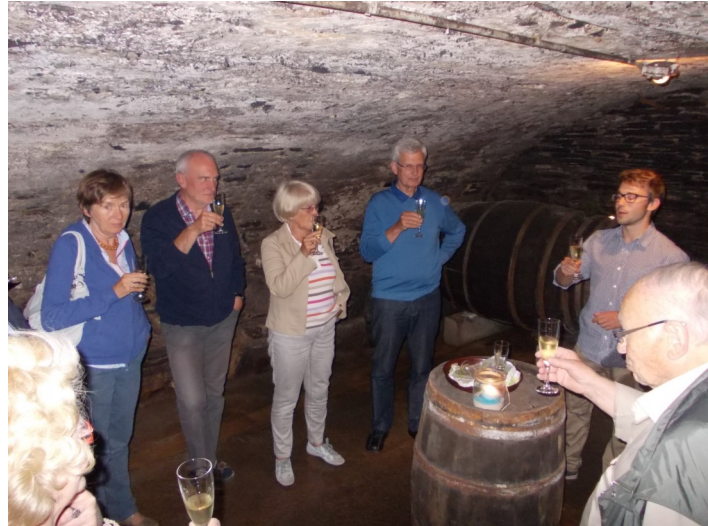
Am ersten Abend stiegen die Teilnehmer zur Weinprobe in den alten Gewölbekeller des Hotels Hanio hinab.

in einem überaus geräumigen Gewölbekeller, der früher zur Lagerung des Weins und heute ausschließlich zur Verkostung von Wein in stimmungsvoller Umgebung benutzt wird.