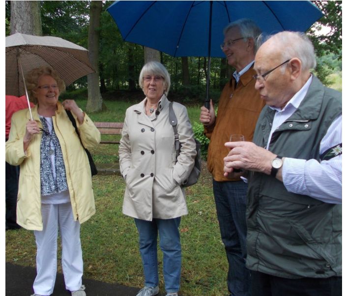
Das Wetter hat leider nicht so mitgespielt, aber das konnte die Laune der Moselbesucher nicht schmälern.

Teil 3 der Unternehmung führt uns von den Weinbergen durch ein Waldstück auf der Hochebene zu einer besonderen Aussichtsplattform.